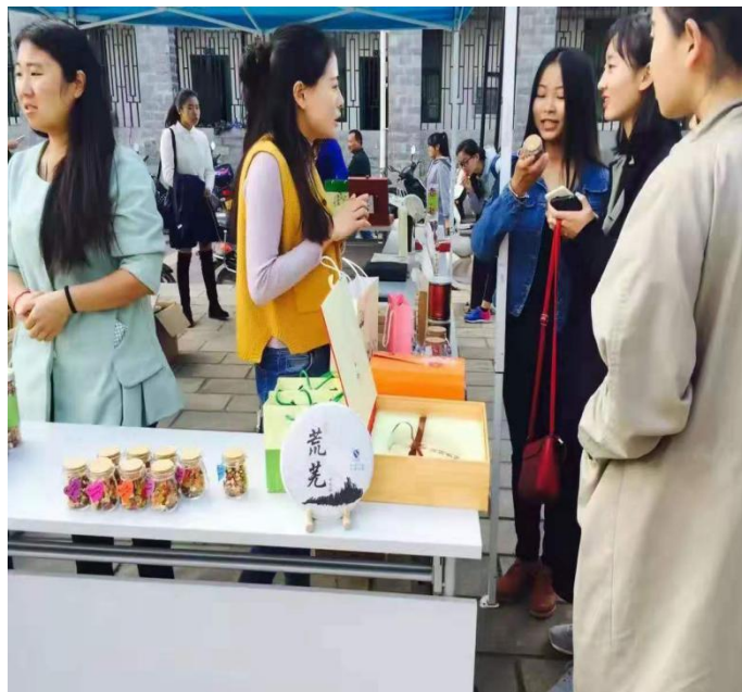
（学校摆摊宣传茶叶）

大一的时候，我经常去茶店做兼职，工作很简单，打扫卫生，泡泡茶等。我很喜欢茶店的氛围，喜欢听老板和顾客聊一些茶叶的知识，就这样我慢慢的积累了不少茶叶的知识。这些兼职的经历为我后来的习茶之路奠定了一定的基础。